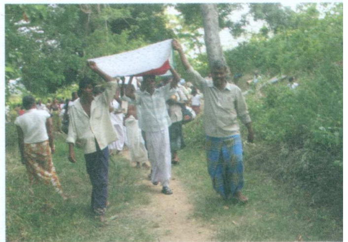
ඡායාරූපය 10 - රෝග නිවාරණ ආශීර්වාද පරහඳු ලබා ගැනීමට ගම්මුත් එක පෙළකට ගමන්කිරීම