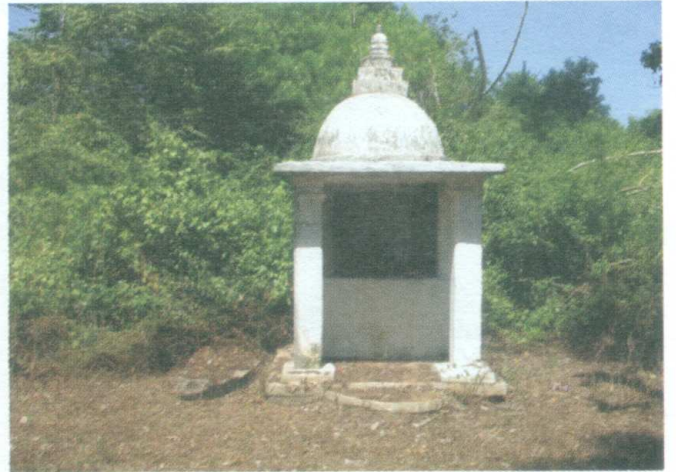
ඡායාරූපය 02 - කකරගම දෙවියන්ගේ රජගෙය