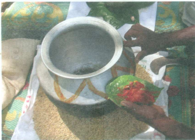
ඡායාරූපය 03 - රජහැලිය ජේ කිරීම හා විසිතුරු කිරීම