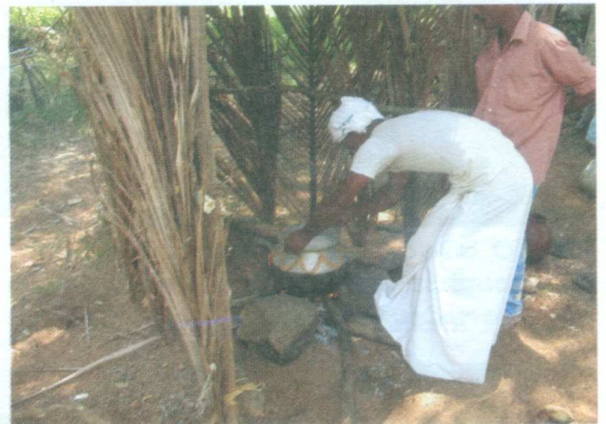
ඡායාරූපය 05 - කිරි ඉතිරවීම