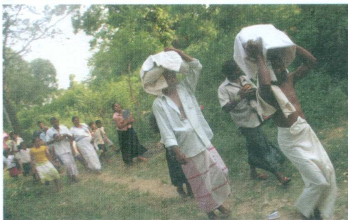
ඡායාරූපය 11 - පට්ටියට/දේවභූමියට දෙවියන් වැඩම කරවීම