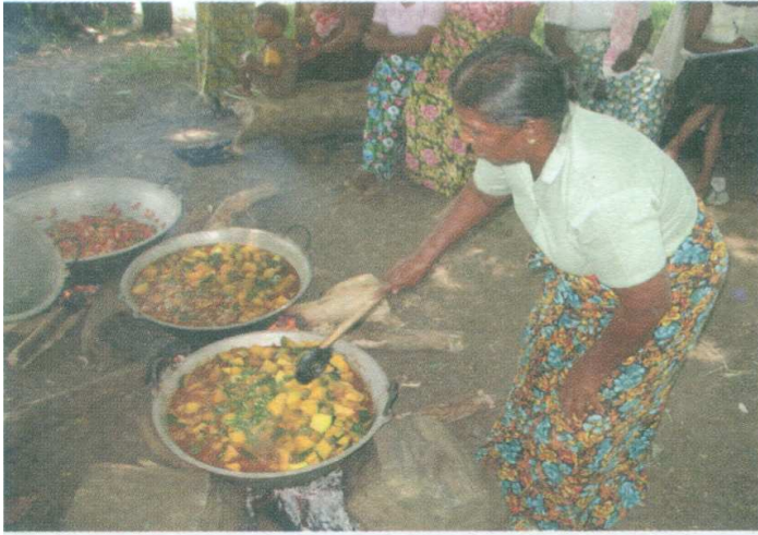
ඡායාරූපය 07 - වට්ටක්කා කිරිහොඳි අගුණුකොළ මැල්ලුම සකස් කිරීම