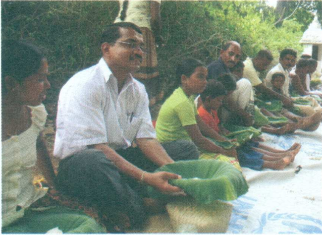
ඡායාරූපය 13 - දානය අනුභව කිරීමට උපදෙස් ලැබෙන තුරු සියලු දෙනා බලා සිටින අයුරු