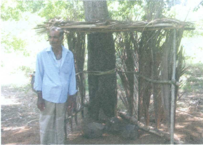
ඡායාරූපය 01 - වැළිමුවපොකාන වැව අද්දර පනම් බැඳ ඇති පනම්ගහ