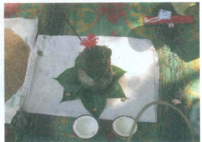
ඡායාරූපය 06 - පුල්ලයාර් මඩය