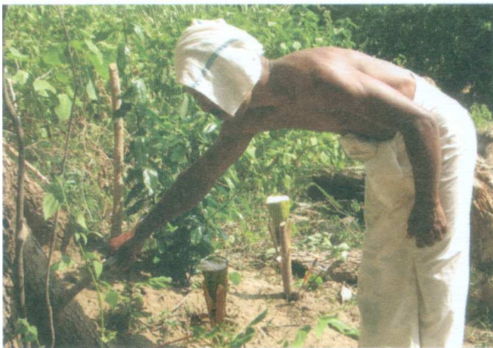
ඡායාරූපය 09 - ජේ කරන ලද පිහියෙන් ගසට කෙටීම