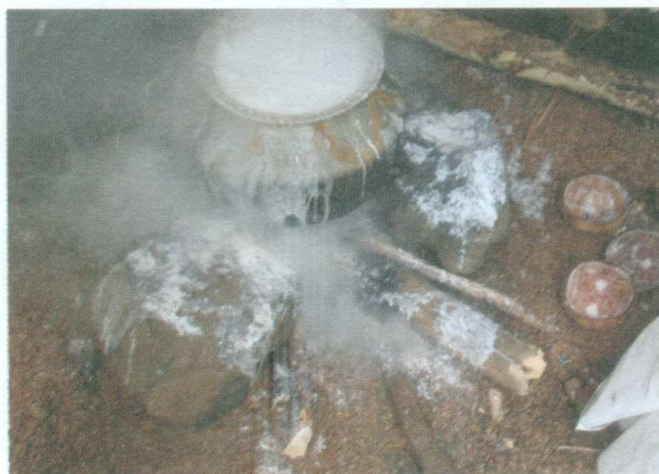
ඡායාරූපය 04 - රජ හැලිය සහල්දමා ලීප තැබීම