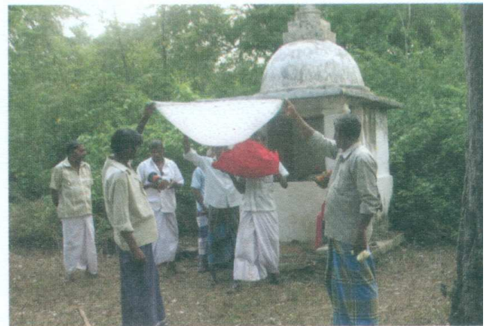
ඡායාරූපය 12 දානය නම්බු කිරීම