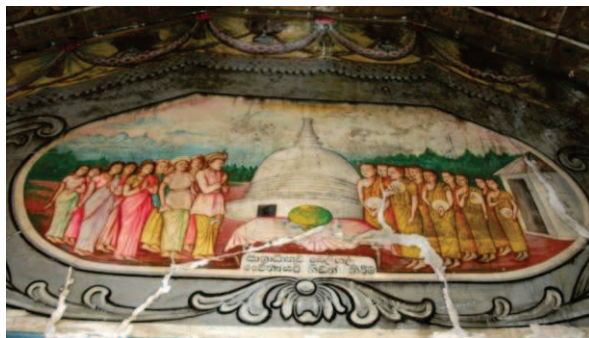
ඡායාරූප අංක 07