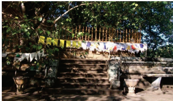
ඡායාරූප අංක 02

මෙම සඳකඩපහණේ සත්ත්ව රූප පිළිබඳව අවධානය යොමු කිරීමේ දී දෙකෙළවරින් පටන් ගන්නා සත්ත්ව රූප මධ්‍යයේ දී හමුවන ලෙසට සකස් කර තිබේ. මධ්‍යයෙහි පද්මය උස්කොට පිහිටුවා ඇත. සඳකඩපහණ අර්ධ කවයකට වඩා වැඩිවන ලෙස නිමවා තිබෙන අතර මෙහි දෙපසින් මකර රූප දෙකක් විද්‍යාමාන වේ. අවසාන කවයේ දකුණු හැකි වන්නේ ගිනිදල් වන අතර පිළිවෙළින් සිංහ, ඇත්, අශ්ව රූප කවාකාරව විහිදී පද්මය වෙත පිවිසෙන අයුරු හඳුනාගත හැකි ය. සිංහ රූප පෙළෙහි හිස් පිටුපසට හැරී පැවතීම, ඇත් රූප පෙළෙහි පිටුපස කකුල් මඳක් ඔසවා ගෙන සිටීම හා අශ්වයන් දස දෙනෙකු ඇතුළත කවයේ දකුණු ගැනීමට හැකිවීම සුවිශේෂී වේ. සෞභාග්‍යයේ සංඛේතය සනිටුහන් කරන ශිලාමය පුන්කළස් දෙකක්