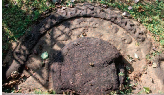
ඡායාරූප අංක 01

මෙම සඳකඩපහණේ සත්ත්ව රූප පිළිබඳව අවධානය යොමු කිරීමේ දී දෙකෙළවරින් පටන් ගන්නා සත්ත්ව රූප මධ්‍යයේ දී හමුවන ලෙසට සකස් කර තිබේ. මධ්‍යයෙහි පද්මය උස්කොට පිහිටුවා ඇත. සඳකඩපහණ අර්ධ කවයකට වඩා වැඩිවන ලෙස නිමවා තිබෙන අතර මෙහි දෙපසින් මකර රූප දෙකක් විද්‍යාමාන වේ. අවසාන කවයේ දකුණු හැකි වන්නේ ගිනිදල් වන අතර පිළිවෙළින් සිංහ, ඇත්, අශ්ව රූප කවාකාරව විහිදී පද්මය වෙත පිවිසෙන අයුරු හඳුනාගත හැකි ය. සිංහ රූප පෙළෙහි හිස් පිටුපසට හැරී පැවතීම, ඇත් රූප පෙළෙහි පිටුපස කකුල් මඳක් ඔසවා ගෙන සිටීම හා අශ්වයන් දස දෙනෙකු ඇතුළත කවයේ දකුණු ගැනීමට හැකිවීම සුවිශේෂී වේ. සෞභාග්‍යයේ සංඛේතය සනිටුහන් කරන ශිලාමය පුන්කළස් දෙකක්