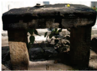
ඡායාරූප අංක 05

පියගැටපෙළේ පළමු පෙළේ සිට සිව්වන පෙළ දක්වා 30cm පළලකින් යුක්ත වන අතර ඉහළ ම පෙළ 48cm පළලින් යුක්ත වේ. ජනප්‍රවාදයේ දැක්වෙන අන්දමට මෙම විහාර ගෙයෙහි වහලයේ රන් උළු සෙවිලි කළ බවකි. ස්තර දෙකකට වහලය ගොඩනගා තිබීම විශේෂත්වයකි. වර්තමානය වනවිට සුදු හුණු ආලේප කර තිබෙනු හදුනාගත හැකි අතර දළ වශයෙන් 13m 44cm, 9m 50cm යුක්ත ව පිළිවෙලින් දිගින් හා පළලින් යුක්ත වේ. ගොඩනැගිල්ල වටා ගල් කණු යොදා ඉදිකර තිබෙන අතර පිටත බරාදයේ විශාල ගල් කණු 4ක් හා කුඩා ගල් කණු 5කි. වර්තමානය වනවිට ගල් කණු කිහිපයක් විනාශ වීම හේතුවෙන් ඒවාට දූව කණු එක් කිරීමක් ද හදුනාගත හැක. ගල් කණු වහලයේ ලිවලට සම්බන්ධ කර ඇත්තේ කුඩුම්බි යොදා ගැනීම තුළින් ය. ඇතුළුවන දොරටුව දෙපස ගල් කණු දෙකෙහි ඉහළ කොටස හතරැස්ව ද පහළ කොටස අටැස්ව ද සකස් කර තිබේ. මෙහි විශාල ගල් කණුවක් 32x32cm යුක්ත අතර කුඩා ගල් කණුවක් 23x25cm ප්‍රමාණයෙන් යුක්ත වේ. කුඩා ගල් කණුවක උස දළ වශයෙන් 1m 95cm පමණ වේ. විහාරය තුළට පිවිසීම සඳහා දොරටු දෙකක් පිහිටුවා තිබෙන අතර විහාරය ඇතුළතින් පිටවීමට තවත් දොරටුවක් පසුපස බිත්තිය හා සම්බන්ධ වී පවතී. විශාල සැතපෙන බුද්ධ ප්‍රතිමාව හා අනෙකුත් බුද්ධ ප්‍රතිමා මහනුවර යුගය පිළිබිඹු කරන මුදුරා සම්ප්‍රදාය නිරූපණය කරයි. සුවිසි විවරණය සිතුවම් කර තිබෙන අතර මින් ද මුදුරා සම්ප්‍රදාය නිරූපණය කරයි. වහලයේ සිවිලිම දූවයෙන් සකස් කර එහි විවිධ මෝස්තර රටා නිරූපණය කර තිබේ. විවිධ ප්‍රමාණයේ නෙළුම්මල් මෝස්තර, මල් මෝස්තර, සත්ත්ව රූප හා ලියවැල් මෙහි සුවිශේෂත්වයක් උසුලයි. විහාරය තුළ වහලය දිරාපත්වීම හේතුවෙන් වර්තමානයේ දූව මුක්කු