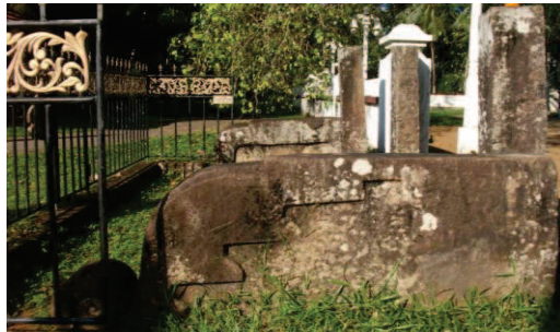
ඡායාරූප අංක 03

බෝධින් වහන්සේ අසල රන් වැටක් ද සහිත ව වටා ගෞලමය අලංකාර බොරදම් හා කැටයම්න් යුක්ත හතරැස් ප්‍රාකාරයක් දක්නට ඇත. දළ වශයෙන් ප්‍රාකාරයේ වටා දිග 12m 15cmක් හා පළල 12m 11cmක් වන අතර දෙවන මළුවට පිවිසීමට ගෞලමය සඳකඩපහණක් හා පියගැටපෙළකි.