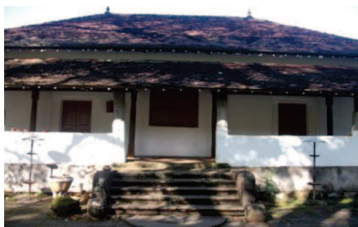
ඡායාරූප අංක 04

මහා විහාර මන්දිරයට පිවිසෙන ස්ථානයේ අලංකාර ශිලාමය සඳකඩපහණ, කොරවක්ගල් මෙන්ම කුඩා ප්‍රමාණයේ පියගැටපෙළකි. අර්ධ වෘත්තයේ විෂ්කම්භය දළ වශයෙන් 1m 90cmක් පමණ වන අතර කැටයම් රහිත මෙහි මධ්‍යයේ ඇති කුඩා අර්ධ වෘත්තය මඳක් උස් ව පිහිටා තිබේ.