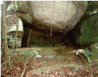
කටාර රහිත ගල් ලෙන්

මූල ඓතිහාසික (Proto Historic) ජනාවාස ඉදිවීමේ දී මෙම කන්ද ආශ්‍රිත ප්‍රදේශය ඉතාම වැදගත් වූ බව පෙනේ. ඒ මන්ද යත් ජනාවාසයක් ඉදි කිරීමේ දී අවශ්‍ය වන වාසස්ථානයකට සුදුසු පරිසරය මෙහි පැවතීමයි. පදවිගම්පල කන්ද පුරා විහිදුණු පාෂාණ උද්ගතයෙහි ස්වභාවික ලෙන් විශාල ප්‍රමාණයක් හඳුනාගත හැකි ය. මෙහි කරන ලද ගවේෂණයේ දී පැහැදිලි වූයේ ගල් ලෙන් 50 ට අධික ප්‍රමාණයක් පවතින බවයි. එහි කටාර සහිත හා කටාර රහිත ගල් ලෙන් විශාල සංඛ්‍යාවක් විසිරී පවතී. මෙම ගල් ලෙන් සියල්ල ම මුල් ඓතිහාසික අවධියේ දී (Early Historic) වාසස්ථාන සඳහා භාවිත කළ බව උපකල්පනය කළ හැකි ය. තෙත් කලාපීය ප්‍රදේශයක් වුව ද මෙහි අධික වර්ෂාපතනයක් දක්නට නො ලැබේ. ඒ අනුව වැසි සමයේ දී කටාර සහිත ගල් ලෙන් වල හික්ෂුන් වහන්සේ ජීවත් වූ බව එහි සඳහන් ලෙන් ලිපි තුළින් හඳුනාගත හැකි ය (IC.vol i : no 800 - 802). නමුත් මෙහි පවතින කටාර රහිත ගල් ලෙන් වුව ද වර්ෂාවෙන් ආරක්ෂා වී ජීවත් විය හැකි පරිදි සකස් වී ඇති ස්වභාවික ගල් ලෙන් වේ. මූල ඓතිහාසික අවධියේ ගොඩනැගුණු ජනාවාස ග්‍රාමීය මට්ටමේ ජනාවාස වුව