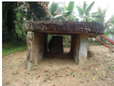
ශිලා මංචක සුසානය

(මැන්දිස්,අබේවර්ධන,දිසානායක 2015 : 14). ඇතැම් විද්වතුන් මෙය ප්‍රාග් ඓතිහාසික යුගයට අයත් එකක් බව උපකල්පනය කළ ද ප්‍රදේශවාසීන් මෙය ගල් මැස්සක් ලෙස හඳුන්වනු ලබයි (Hocart 1928-1933 : 96 - 97, Paronavitana 1967 : 7 - 8,1948 : 21). මෙය ප්‍රාග් ඓතිහාසික යුගයකට අයත් වුවත් නොව මූල ඓතිහාසික යුගයට අයත් සුසානයක් බව ඉන්දියාවේ දක්නට ලැබෙන මූල ඓතිහාසික ඩොල්මන් සුසාන සමග සන්සන්දනයේ දී පෙනේ. නමුත් පදවිගම්පල ශිලා මංචකය තනි ව පිහිටන නිසාත් එ වැනි ස්වභාවයක් ඉන්දියාවේ දක්නට නො ලැබෙන නිසාත් මෙය නිශ්චිත ව හඳුනාගැනීමට නව පර්යේෂණ සිදු කළ යුතු ය (Seneviratne 1984 : 262). දළ වශයෙන් ක්‍රි:පූ 8 වන සියවසේ සිට ක්‍රි:ව 3 වන සියවස දක්වා වූ කාල පරාසයක් මෙයට අයත් වේ. මෙම සුසානය සිරස් අතට පිහිටූ වන ලද විශාල ගල් පුවරු 3 ක් මත එ වැනිම විශාල ගල් පුවරුවක් තබා සකස් කරන ලද්දක් බව පෙනේ. මෙම සුසානය පොළවෙන් අඩි 8 ක් පමණ ඉහළට වන්නට සකස් කර ඇත. මෙම ශිලා මංචකයේ නැගෙනහිර පසින් ඇති ගල් පුවරුවේ මෙගලිතික රූපාක්ෂරයක් දැකගත හැක (රඹුක්වැල්ල 1998 : 17 - 22).