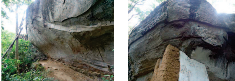
කටාර හා පියසි ඉදිකළ ගල් ලෙන්

ද කඳුකර සහිත පරිසරයක් තුළ මෙවැනි ලෙන් වුව ද ඔවුන් භාවිත කරන්නට ඇතැයි උපකල්පනය කළ හැකි ය. එමෙන් ම තමන්ට ඒදිනෙදා අවශ්‍ය වූ නොයෙකුත් ආහාර ද මෙම ප්‍රදේශ වලින් සොයා ගැනීම පහසු කාර්යයක් බැවින් වාසස්ථාන ඉදිකර ගැනීමේ දී මෙ වැනි ස්වභාවික ව පිහිටි ගුහා උපයෝගී කරගනු ලැබීම වඩාත් උචිත වේ.