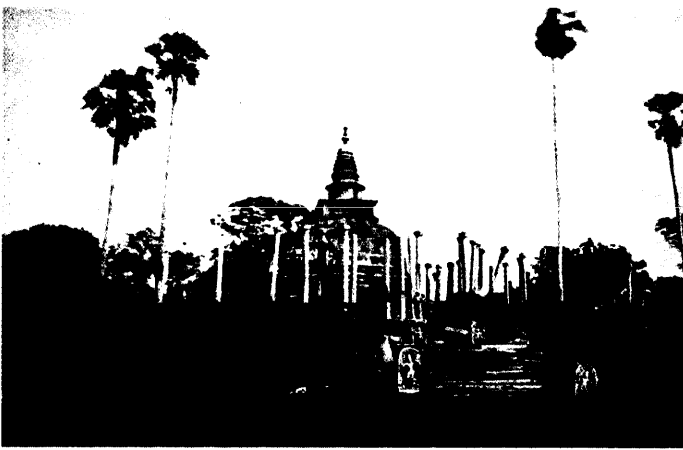
පුපාරාමයේ චේතියසරයේ සාධක (1900 දශකය)

ඉන්දියාව ආශ්‍රයෙන් බිහිවන චේතියසර සංකල්පය ලංකාවට පැමිණියේ කිනම් කාලයක දී ද යන්න නිශ්චිතව සඳහන් කළ නොහැකිය. මහාවංශය දක්වන පරිදි වසභ රාජ්‍යය යුගයේ (ක්‍රි.පූ. 67-111) දී චේතියසරයක් නිර්මාණය වූ බවට සාධක සඳහන් වේ. එහෙත් පරණවිතානායන් දක්වන පරිදි චේතියසරවල ආරම්භය ක්‍රිස්තු වර්ෂ 7 හෝ 8 වැනි සියවස් දක්වා ගමන් කරන බවත් ඒ පිළිබඳව පුරාවිද්‍යාත්මක සාක්ෂි ද පවතින බවත් දක්වයි. මෙහි විශේෂ ලක්ෂණය වන්නේ ඉන්දියාව තුළ දී චේතියසර සම්ප්‍රදායේ ආරම්භය සනිටුහන් වුවත්, මෙරටට කුමන යුගයක දී චේතියසර ආරම්භය සිදු වුවද මෙරට කලාකරුවාට අනන්‍ය ලෙස මෙම වාස්තුවිද්‍යාත්මක අංගය නිර්මාණය කර ගත් බව දැකිය හැකි වීමයි.