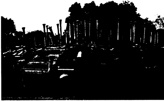
ලංකාරාමයේ චේතියසරයේ සාධක (1900 දශකය)

බොහෝමයක් චේතියසර මළුව වටකුරු ස්වාභාවයක් ගනී. එහෙත් රාජාංගනය හස්තිකුවච්චි විහාරයේ හතරැස් ආකාරයේ මළුවක් පවතී. චේතියසරය සඳහා ගල් කණු යොදා ගැනීමේ දී ගල් කණු පේලි අතර සම්මත ප්‍රමාණක් දැකගල නොහැක. එය ගල් කණු පේලි දෙකක්, තුනක් හෝ හතරක් වශයෙන් වෙනස් විය හැකි ය. ගල් කණු පේලි හතරකින් යුක්ත චේතියසරයක් ලෙස ටුපාරාමයත්, ගල් කණු පේලි තුනකින් යුක්ත චේතියසර ලෙස ලංකාරාමය, පොළොන්නරුව හා මැදිරිගිරිය වටදාගෙවල් ද ගල් කණු පේලි දෙකකින් යුක්ත චේතියසර ලෙස තිරියාය, අම්බස්තලය, අත්තනගල්ල චේතියසර ද දැක්විය හැකි වේ. මෙහි දී පොළොන්නරුවේ වටදාගෙයි ගල් කණු පේලි තුනට අමතරව දැව කණු පේලි තුනක් ද පවති බවට සාධක හඳුනාගත හැකි වේ.