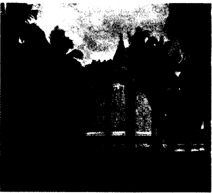
මිහින්තලයේ අම්බස්තල චේතියසරයේ සාධක (1900 දශකය)

මෙරට චේතියසර නිර්මාණයේ ආරම්භය පෙර දැක් වූ ලෙස වසභ රාජ යුගයට (ක්‍රි.පූ. 65-109) දක්වා දිවයයි. දේවානම්පිය තිස්ස රජු (ක්‍රි.පූ. 250-210) විසින් නිර්මාණය කරන ලද පුපාරාම ස්තූපය අරභයා මොහු විසින් දා ගෙයක් නිර්මාණය කළ බව මහාවංසයේ තිස්සස්ථවන පරිච්ඡේදයේ සඳහන් කරයි. එහි සාධක දැනුණු පුපාරාමය ස්ථූපය ආශ්‍රයෙන් අපට හඳුනාගත හැකි වේ. එසේම මෙම රාජ්‍යය යුගයේ දී තවත් චේතියසරයක් නිර්මාණය කළ බවට සාධක හමු වේ. එනම් මහාවංසය සඳහන් කරන පරිදි රජුගේ පුත්තා නම් මහේෂිකාව විසින් චේතියසරයක් නිර්මාණය කළ බව සඳහන් වේ. "ඒ රජහුගේ ප්‍රසිද්ධ වූ බිසව බෝ මඬවෙහිම සිත්කළු වූ වෘත්ත නම් සෑයෙක් දා සෑ ගෙය ද කරවීය" 1