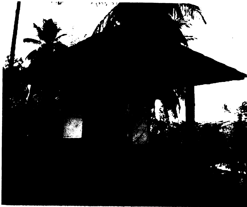
ජායාරූපය - ගොඩමුන්න අම්බලම