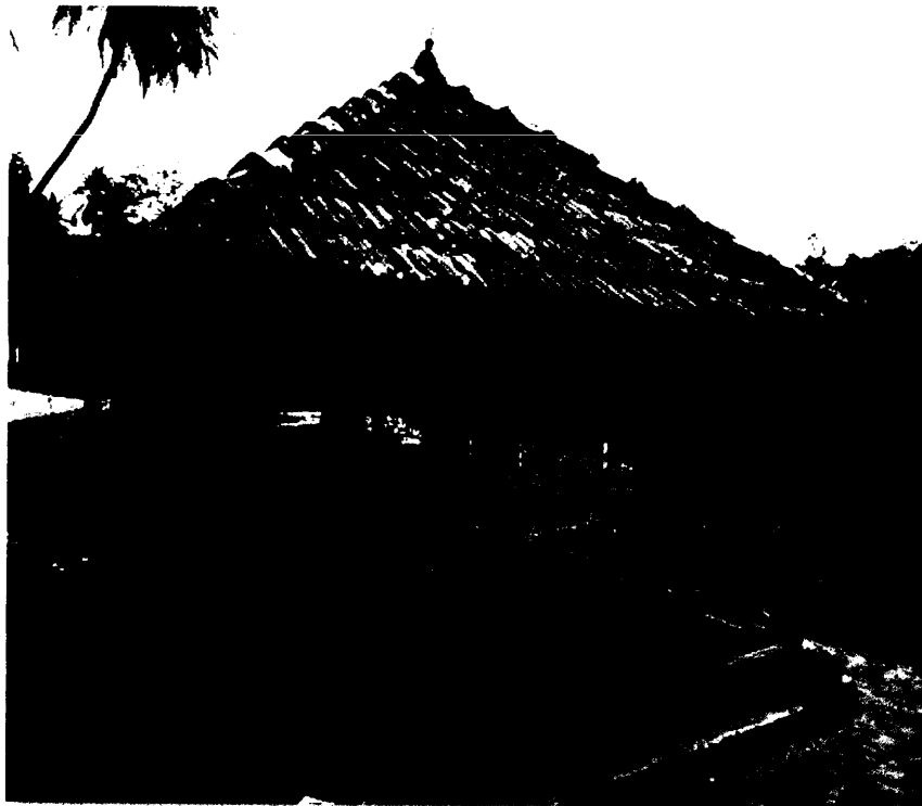
ඡායාරූපය 03. කන්දෙවෙල පුරාණ අම්බලම