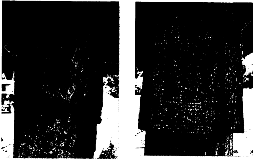
ඡායාරූපය 01-02. මාස්සන අම්බලමේ දැවකණුවල කැටයම්