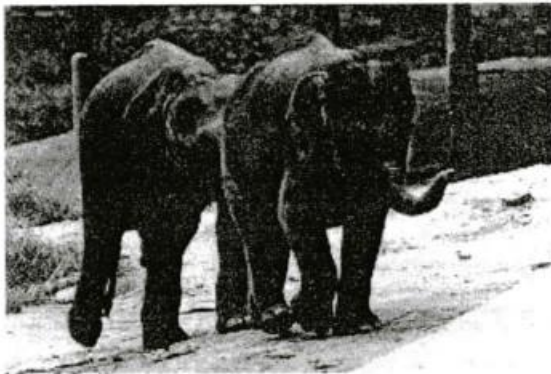
අප්‍රිකානු සැවනා අලියා