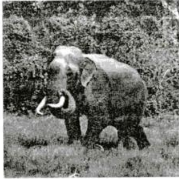
ශ්‍රී ලංකානු අලියා