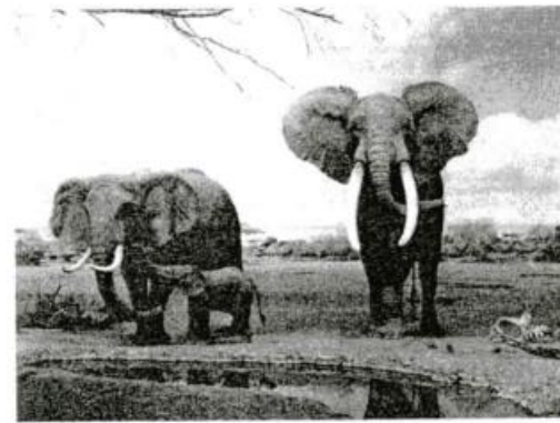
අප්‍රිකානු චනාන්තර අලියා

නමුත් මෙම අධ්‍යයනයේදී අවධානය යොමු කරන්නේ ශ්‍රී ලංකානු අලියා පිළිබඳව ය. ශ්‍රී ලාංකීය සමාජය තුළ අලි ඇතුන් මෙල්ල කිරීම හා ඔවුන්ගෙන් සේවය ගැනීම ආදී රාජකාරී පැවරුණු සමාජ කොට්ඨාසය අයත් වූයේ "දුර" යන කුලයටය. ඒ අනුව "පන්තදුර" යනු ඇත් ගොවිවත්ය. ඔවුන් අලි ඇතුන් අල්ලා මෙල්ල කොට සුදුසු පරිදි වාරිත්‍රානුකූලව ආගමික හා සංස්කෘතික සන්දර්ශන හා පෙළපාලි වෙනුවෙන් සහභාගී කරවති. "Sinhala literature of the 3rd Century BC indicates that the state elephant or Mangalahatti was the elephant on which the king rode. This elephant was always a tusker and had a special stable called the hatthisala. The post to which it was tethered was called the albeka." (Jayawardhena, Living Heritage Magazine) ඒ අනුව රජු ගමන් කරනු ලබන්නේ "මංගල හස්තියා" කර මතය. එම මංගල හස්තියා වාසය කරන ස්ථානය "හස්තිසල" වන අතර මංගල හස්තියා ගැටලසමින් ආවරණය කරන තනතුර "අල්හක" ලෙස නම් කර තිබුණි.