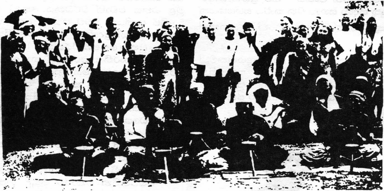
ලංකාවේ මරිච්චුකුඩාහි සිටි භාරතීය මුතු ශිල්පීන් පිරිසක් (මූලය Kunz and Stevenson, 1908, 114)

දින නිවාඩු දිනයක් වශයෙන් පවත්වා ගනිමින් අරිප්පුවේ දේවස්ථානයේ දේව මෙහෙයන්ට ද එක් වූහ (Percival, 1805, 88., 1990,62). පරවාචරුන් සමඟ ම එක්ව හමුවන තවත් යෙදුමක් වන පට්ටන්ගටයින් ( Pattangatyn ) යන්න තනතුරු නාමයක් ලෙස ව්‍යාවහාර වූවකි (Thurston, 1909, 154). යාපනයේ පට්ටන්ගටයින් වූ දොන් රොද්‍රිගෝ, පරුවා, කරියා සහ පල්ලෙවෙල්ලිවරුන්ගේ ප්‍රධාන පට්ටන්ගටයින්වරයා, පට්ටන්ගටයින්වරුන්ගේ කතකපුල්ලේවරු පිළිබඳ ව සඳහන් ඔලන්ද වාර්තා අතරින් හමුවේ (Hornell, 1922, 174). මෙය ඉහත ද දැක්වූ ආකාරයට පරවාචරුන්ගේ නම් සමඟ යෙදී ඇති තනතුරක් වුව ද සමානව ම මුස්ලිම්වරුන්ට ද යෙදී ඇති බැවින් එක් විශේෂ වාර්ගික කොටසකට සුවිශේෂී වූ තනතුරක් නොවූ බව කිව හැකි ය.