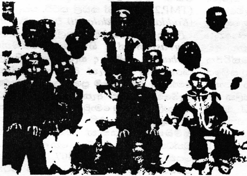
රූපය 1. පර්සියානු ජාතික මුස්ලිම් මුතු වෙළඳුන්ගේ දරුවන් පිරිසක් ලංකාවේදී

පෞද්ගලිකව වෙළඳකටයුතුවල දී තමන් ම පෙනී නොසිටියහ. ඔවුන් නිසැකව ම නියෝජනයන් මගින් ක්‍රියාත්මක වූහ. සේව්වරුන් නිතර ම සඳහන් කළේ තමන්ගේ කුලීනත්වයන් සුළඟත් අතරට නුගත් මහජනයා පැමිණෙනවාට තමන් අකමැති බවයි (Furguson & Furgosun, 1888, 385)".