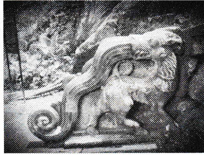
කැටයම් සහිත කොරවක් ගල

විහාරගෙය තුළ කුළුණු ශෛලමය ස්ථම්භ වන අතර සිවිලිම නිර්මාණය කර තිබෙන්නේ විශාල ශෛලමය ශිලා ස්ථම්භ යොදා ගෙන ය. මෙහි වන ස්ථම්භ අතර දැනට ශේෂව පවතින ස්ථම්භ දෙකක මධ්‍යයේ ඉතාමත් අලංකාර ලෙස සිංහ මුහුණ කැටයම් කර තිබෙන අතර සිංහ මුහුණ ඉතා සියුම් ලෙස නිර්මාණය කර තිබේ. තව ද එක් කණුවක මකර තොරණ සහිතව බුදු රුවක් නෙලා ඇති අතර තවත් මෙවැනි විවිධ කැටයම් සහිත ශිලා ස්ථම්භ කිහිපයක් විහාරය තුළ තබා තිබේ. මෙම විහාරයේ සුවිශේෂී කැටයම් සහිත ස්ථානයක් ලෙස කොරවක්ගල හඳුනාගත හැකි ය. සිංහ කදකට මකර මුහුණක්