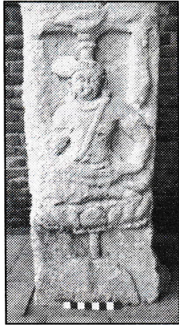
ජායාරූප අංක 01 යධාලනිස්ස ආයතනය අනුමාන කුචේර කැටයම 01