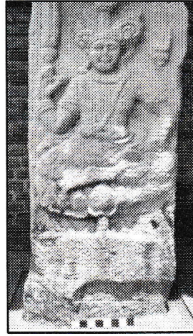
ජායාරූප අංක 02 යධාලනිස්ස ආයතනය අනුමාන කුචේර කැටයම 02