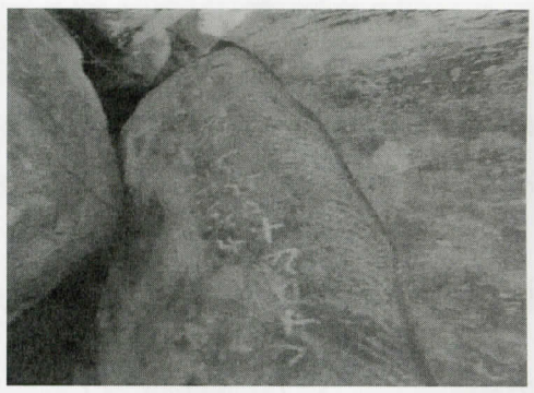
පූර්ව බ්‍රාහ්මී සෙල්ලිපිය