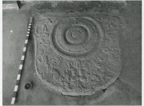
නාථ දේවාලයේ සඳකඩපහණ