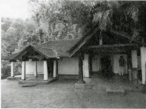
වේගිරිය නාඨ දේවාලය සහ රජමහා විහාරය