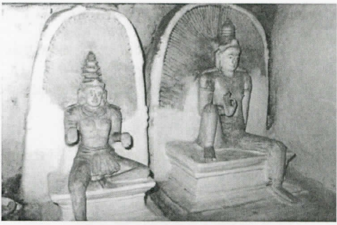
නාඨ දේව ප්‍රතිමාව සහ තාරා දෙවඟනගේ ප්‍රතිමාව