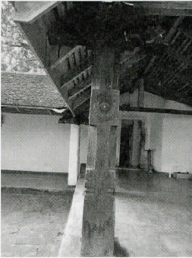
දූව කැටයම් සහිත කණු