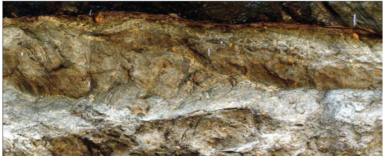
සෙනසුම්ගල විහාර ලිපිය (කඩඉරි මගින් අක්‍ෂර පැහැදිලි ස්ථාන පෙන්වුම් කෙරේ.)

මෙම ගල් ලෙන් ඉහළ කටාරයට පහළින් පැරණිම කාලයට අයත්, පූර්ව බ්‍රාන්ච් ලෙන් ලිපියක් දැකගත හැකි අතර බෙහෙවින් විනාශ වී ඇති ලිපියේ පියවි ඇසින් දැක හඳුනාගත හැක්කේ අක්‍ෂර කීපයක් පමණි.