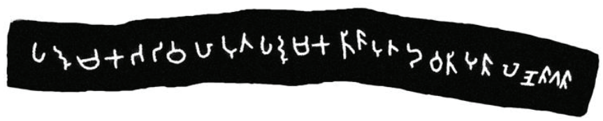
ලුණුබොක්ක, නාගිරි ආරණ්‍ය සේනාසනයේ ලිපි අංක 2 (ජායාරූප පාදක කරගෙන පරිගණකයෙන් සකසන ලද පිටපතකි)

අතිවොඩ . . . ග තිස්සගේ ලෙණ. පැමිණියා වූත් නොපැමිණියා වූත් සිව්දිග සංසයාටයි