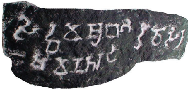
ගින්නෝරුව කන්ද ලෙන් ලිපිය

කන්ද මධ්‍යයේ තිබෙන කටාර කෙටු එක් ගල්ලෙණක කටාරයට පහළින් අපර බ්‍රාහ්මී යුගයට අයත් මෙම ලෙන් ලිපිය කොටා ඇත.