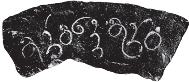
ටැම්ගොඩ විහාරයේ ගඬොළ කැටය මත ලියූ ලිපිය

ස්පර්ශ ලාංඡනය පළමු වරට මෙම ලිපියේ පල වේ.) හා තවත් එවැනි ම ලේඛනයක් සහිත ගඬොළ කැටයක් පිළිබඳ ව පරණවිතාන විසින් සඳහන් කළ ද (1955:81) මේ වන විට අනෙක් ගඬොළ කැටය දැකගැනීමට නැත. පරණවිතානට අනුව අදාළ ලිපිය හා අර්ථය පහත පරිදි ය.