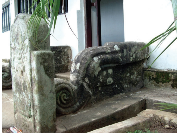
මෙම කොරවක්ගල මත මෙම කෙටි ලිපිය සටහන් කර ඇත.