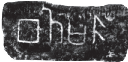
පහළ කඩුගන්නාව මාවෙල කන්දේ රජමහා විහාරයේ කොරවක්ගල මත ඇති ලිපිය