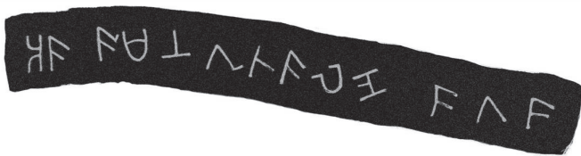
මොරගොම්මන, ඉනුල්දෙණියගොඩකන්ද ලිපිය (නේත්‍ර පිටපතකි)

බදුල්ල දිස්ත්‍රික්කයේ බිබිල ප්‍රදේශීය ලේකම් කොට්ඨාසයට අයත් නාමාපොල 103 සී, කොල්ලාකැටිය ග්‍රාම නිලධාරි වසමේ මොරගොම්මන, ඉනුල්දෙණියගොඩ කන්ද පිහිටා තිබේ (07° 21' 03.6", 081° 00' 58.6"). මැටිගහපුගල්ගේ, වෙදගල්ගේ ආදී නම්වලින් හඳුන්වන කටාර කෙටු ගල්ගුහා ඇතුළු තවත් ගල්ගුහා කීපයක් ම මෙම කන්ද පුරා විසිරී තිබේ. කන්දේ තැන තැන නිධන් භොරුන් විසින් කරන ලද විනාශ කිරීම් දකින්නට ඇත. මෙම කන්ද මුදුනේ ගල් ලෙනක කටාරයට පහළින් පහත දැක්වෙන සෙල්ලිපිය සටහන් කර ඇත. බොහෝ ගල්ලෙන් ලිපි මෙන් ම මෙම ලිපිය ද තරමක් ගැඹුරට සටහන් කර ඇති අතර ලංකාවේ දක්නට ලැබෙන පූර්ව බ්‍රාහ්මී සෙල්ලිපි හා අනුගත වෙමින් සාමාන්‍ය ලක්ෂණ පෙන්වුම් කරන ආකාරය දැකගත හැකි වේ.