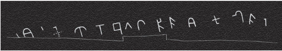
පහළ කඩුගන්නාව මාවෙල කන්දේ රජමහා විහාරය (ලෙන්ලිපි අංක 1) (නේත්‍ර පිටපතකි)

මෙයින් පිළිම ගුහාවේ දක්නට ඇති ලිපිය පුරාවිද්‍යා දෙපාර්තමේන්තුව විසින් පිටපත් කර ඇත. වෛත්‍ය සහිත ගුහාවේ ද තරමක් භායනගයට ලක් වූ පූර්ව බ්‍රාහ්මී ලිපියක් කටාරයට පහළින් කොටා තිබේ. මෑත කාලයේ කරන ලද ශාලා බිත්තියේ නිර්මාණ කටයුතු සමඟ මෙම ලිපියේ වම්පස අකුරු කීපයක් විනාශයට පත් ව ඇති අතර අකුරු 14ක් පමණ හොඳින් හඳුනා ගත හැකි ව පවතී. මෙම ලිපියේ තුන් වන, සය වන, සත් වන, අට වන, දස වන, දහතුන් වන හා පසළොස් වන යන අකුරු උඩුයටිකුරු ආකාරයට ලියා ඇත.