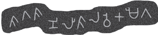
කිරිපොකුණ කන්ද ලිපි අංක 2 (නේත්‍ර පිටපතකි)

පෙළ ගමික (දෙ) තහ ලිණි ගගශ පර්වර්තනය ගමික දෙනගේ ලෙණ සංඝයාටයි