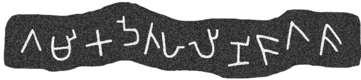
කිරිපොකුණ කන්ද ලිපි අංක 1 (නේත්‍ර පිටපතකි)

ඇති ලෙනේ කටාරයට පහළින් සටහන් කර ඇති ලිපිය ලිපිය දකුණේ සිට වමට ලියැවුණු ලිපියකි. මෙම ලිපි දෙකම ලංකාවේ පැරණිම කාලයට අයත් බ්‍රාහ්මී අක්ෂරයන්ගේ පරමාදර්ශී ලක්ෂණ පෙන්නුම් කරන බව නිරීක්ෂණය කළ හැකි වේ. එකිනෙක සමාන්තරව හා යාබද ව එකම දෙසට මුහුණ ලා පිහිටා ඇති මෙම ගල්ලෙන් ද්විත්වයේම ලෙන් කර්මාන්තය හා ලිපිකරණය එකම අනුග්‍රාහකයෙකුගේ අනුදැනුම මත සිදු වී ඇති බව ඒවායේ දක්නට ලැබෙන ඒකමිතිය අනුව සිතාගත හැකි වේ. එමෙන්ම මෙම ලිපි දෙකම 'ගමික' නම් සමාන තනතුරු දරන පුද්ගලයින් දෙ දෙනෙකු විසින් සකසා පරිත්‍යාග කර ඇත. නමුත් මෙම ලිපි දෙකේ පුද්ගල නාම සමඟ දැක්වෙන සම්බන්ධ විභක්ති ප්‍රත්‍යය පළමු වැනි ලිපිය සඳහා 'හ' වශයෙන් හා දෙ වැනි ලිපිය සඳහා 'ශ' වශයෙන් දෙ ආකාරයෙන් දැක් වේ.