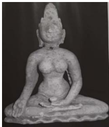
ඵලක 02 - මානාහරණ විහාරයෙන් හමුවූ තාරා දෙවඟන ප්‍රතිමාව