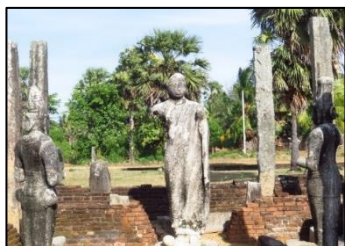
ඵලක 01 - මුහුදු මහා විහාරයේ බුද්ධ හා බෝධිසත්ව ප්‍රතිමා

ක්‍රිස්තු වර්ෂ පස්වන සියවසින් පසුව එවකට ශ්‍රීසිය, රෝමය සහ ආරාබිකරය වෙත තිබූ ගෝලීය ආර්ථික ආධිපත්‍යය ක්‍රමයෙන් විනය ඇතුළු නැගෙනහිර හා අග්නිදිග ආසියාව වෙත ගමන් කිරීම තුළ එම කලාපවල මුල් බැස තිබූ සංස්කෘතික, ආගමික අදහස් හා සංකල්ප පෙර අපර දෙදිග යා කරන මධ්‍යස්ථානයක් වූ ශ්‍රී ලංකාව වැනි රාජ්‍යයකට ලැබීම සිදුවිය හැකිය. මෙකී සංකල්පයන් අධ්‍යයනයට බඳුන්වන විහාරවල වාස්තුවිද්‍යාව හා සම්මිශ්‍රණය වී ඇත්තේ මෙරටට පැමිණි වෙළෙඳුන්ගේ අනුග්‍රහයන් මත ය. ලංකාවේ නැගෙනහිර වෙරළාශ්‍රිතව ඉදි වී ඇති පොතුවිල් මුහුදු මහා විහාරය එලෙස ඉදි වූ විහාරයක් ලෙස උපකල්පනය කළ හැකිය. මෙහි දැනට මතු කර ඇති පිළිමගෙය තුළ බුද්ධ ප්‍රතිමාවක් හා බෝධිසත්ව ප්‍රතිමා දෙකක් දක්නට ලැබේ (ඵලක 01). මේවා නාවුක ගමනාගමනයේ යෙදුනුවන්ගේ අභිලාෂයන් මත වෙරළාශ්‍රිතව ඉදි වී ඇත. සියඹලාණ්ඩුව මානාහරණ විහාරයේ මෑතකදී සිදුකළ කැණීමකදී හි දාගැබ තුළින් තාරා දෙවඟනගේ ප්‍රතිමාවක් අනාවරණය වී ඇත (ඵලක 02).