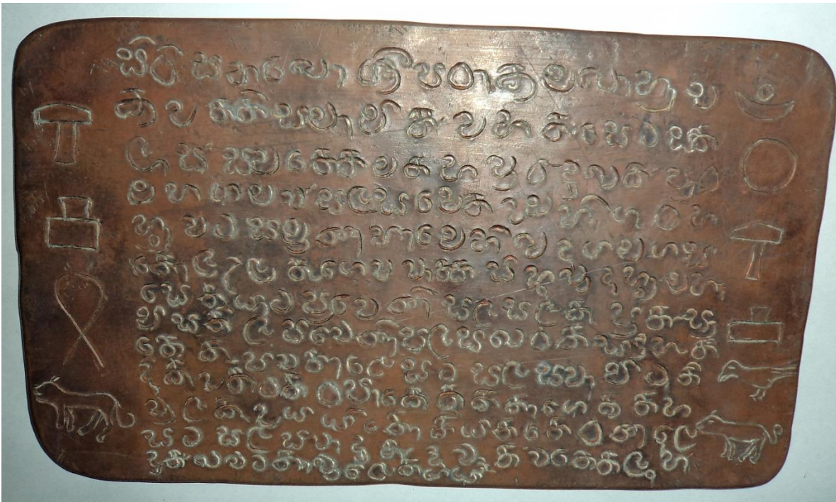
රූපය 01. මහගම තඹ සන්නස

සීමාවන මහගම මඩවල සෙල්ලිපිය අයත් වන පාත දුම්බරට ම අයත් ය. සන්නසේ ඇති පරිදි ප්‍රදානය හිමි මහසෙනසා හා ඔහුගේ පුතාට ආදී වශයෙන් මඩවල ලිපියේ සඳහන්ව ඇති ආකාරයෙන් ම විස්තර සඳහන් ය. මෙහි ද කුඹුරු බිජුවට අමුණු සයක් හා ගහකොළ වකුපිටි ඇතුළත් ය. ඊට අමතරව මඩවල සෙල්ලිපියේ සඳහන් නැති ප්‍රදානයක් ලෙස ආවුද ද පවරා දීමක් සඳහන් ය. මඩවල ලිපියේ මෙන් මෙහි ද කිණිහිරිය මිටිය අඬුව මෙන් ම ඉර හඳ බල්ලා හා කවුඩා රූප සටහන් කර තිබේ. ලිපියේ සඳහන් පරිදි පවරා දුන් භූමිය අයත් වන්නේ මහගම සැලැස්මෙන් (පිඹුරෙන්) උඩහිගුර නම් කුඹුර හා ඉඩම ය. එය ලෝරි විසින් සඳහන් කරන මහගමට අයත් ගහලගම්බොඩ එගොඩගම හා මෙගොඩගම යන ප්‍රදේශ තුනෙන් කුමන කොටසට අයත් දැයි පැහැදිලි නැත. 19 වන සියවසේ වූ එම බෙදීම් 15 වන සියවසේ නොතිබෙන්නට ද ඇත. තව ද මඩවල ලිපියේ ප්‍රදානය හා මහගම සන්නසේ ප්‍රදානය එක ම වර්ෂයේ දී සිදුකර ඇතත් මහගම සන්නස අප්‍රේල් මාසයේත් (බක් පුර) මඩවල දීමනාව මැයි මාසයේත් (වෙසඟ පුර) සිදුකර තිබේ.