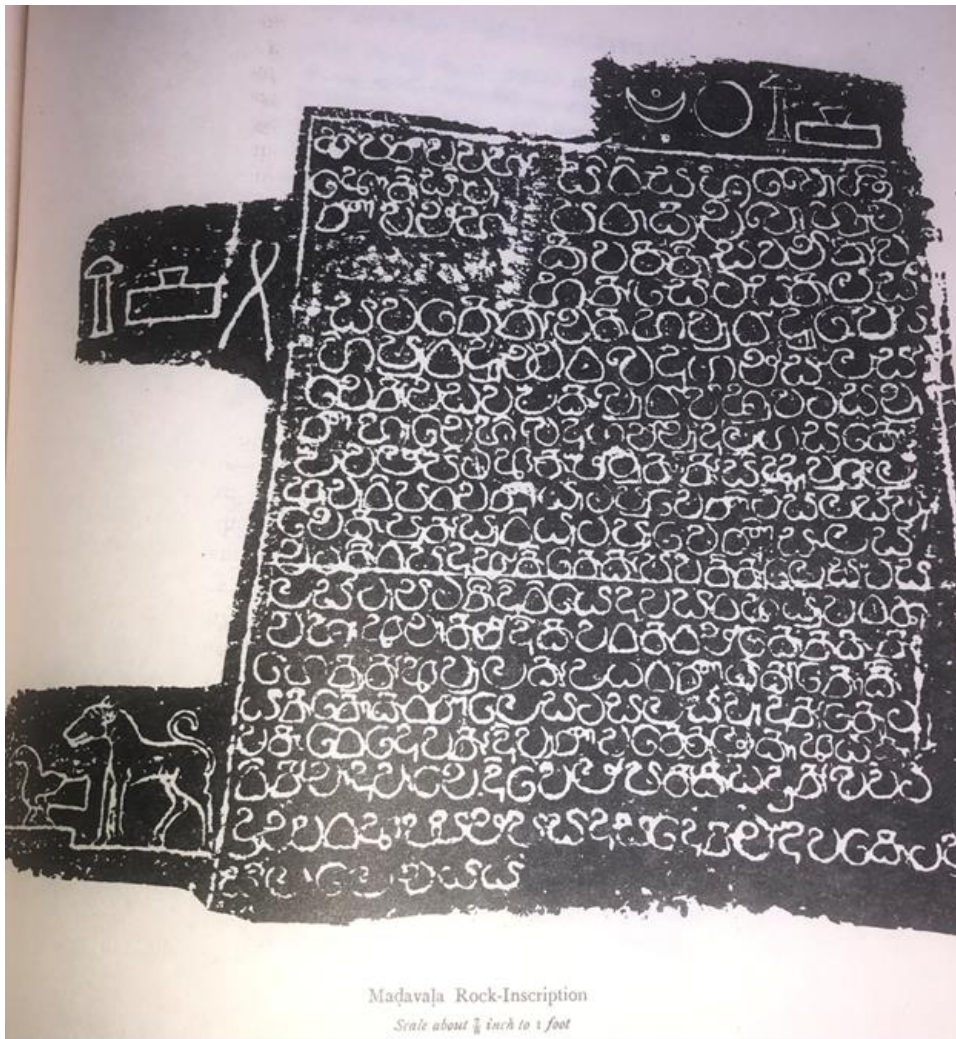
රූපය 02. මඩවල ශිලා ලේඛනයේ ස්පර්ශිත ඡායා පිටපත (EZ. III, no 24)