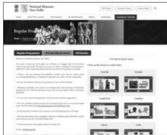
ඡායාරූපය 01 නවදිල්ලි ජාතික කෞතුකාගාරය ආශ්‍රිත ළමා අධ්‍යාපනික වැඩසටහන් ( http://www.nationalmuseumindia.gov.in/en )