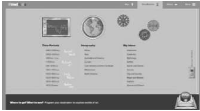
ඡායාරූපය 03 #MetKids වැඩසටහන ( https://www.metmuseum.org/ )