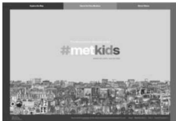
ඡායාරූපය 02 #MetKids වැඩසටහන ( https://www.metmuseum.org/ )