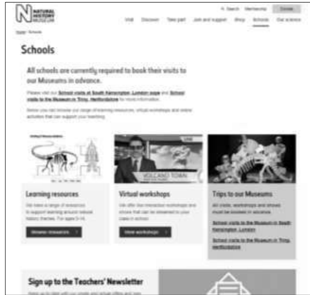
ඡායාරූපය 04 ලන්ඩනයේ ස්වභාවික විද්‍යා කෞතුකාගාරය ආශ්‍රිත ළමා අධ්‍යාපනික වැඩසටහන් ( https://www.nhm.ac.uk/ )