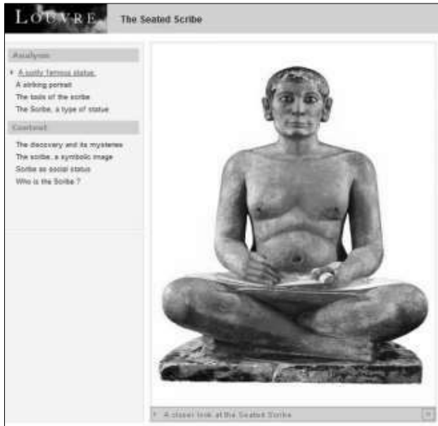
ඡායාරූපය 05 A closer look at the Seated Scribe වැඩසටහන ( http://www.louvre.fr/en )