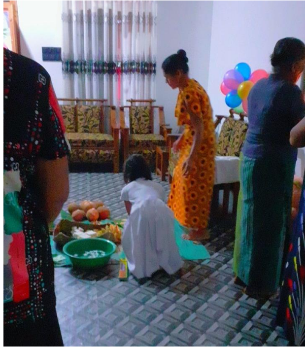
ඡායාරූපය 3. පදියනලාව ප්‍රදේශයේ මල්වර වාරිකු සඳහා දැරියගේ ශ්‍රෝතීන්ගේ දායකත්වය

දී දියණියට තැඟි බෝග ලබා දී සියල්ලෝම පිටව යති. එමෙන්ම මේ කාලයේ දී දියණියට දින තුනක් යනතුරු සවස් කාලයේ දී නිවසින් පිටතට යාමට අවසර නොදෙයි. එමෙන්ම මාස තුනක් යනතුරු ඇයව නිවසෙහි තනි නොකරයි (රත්නායක, 2022). අස්පර්ශනීය උරුමයන් පිළිබඳ සාකච්ඡා කරන ප්‍රජාව පදනම් කරගත් විද්‍යාත්මක ප්‍රවේශයන් (Community Based Approaches) මෙම උරුමයන් පරපුරෙන් පරපුරට ආරක්ෂා කිරීම සම්බන්ධව එකී සමාජයෙහි ප්‍රජාවට ඇති වගකීම පෙන්වා දී තිබේ. ඒ අනුව පදියනලාව ප්‍රදේශයෙහි මල්වර වාරිකු සම්බන්ධ සෑම කටයුත්තකදීම එම දැරියගේ ශ්‍රෝති ප්‍රජාවගේ දායකත්වය මැනවින් දෘශ්‍යමානය. මෙවැනි කාර්යයන් පිළිබඳ හසල දැනුමක් ඇති වැඩිහිටි ප්‍රජාව මෙහිදී මූලිකත්වය ගෙන තිබේ. වාරිකු පිළිබඳව ඔවුන් එකිනෙකා සාකච්ඡා කරමින් කිසිදු වැරදීමකින් තොරව ඒවා අකුරටම ක්‍රියාත්මක කිරීමට ගන්නා වැයම හොදින්ම ප්‍රකට වේ. මෙහිදී වැඩිවියට පත් වූ අවස්ථාවේ සිටම පවුල තුළ තමන්ට ඇති සුවිශේෂිත ස්ථානයත්, සමාජය තුළ තමන් හුදකලා වර්තයක් නොවන වගත් හැඟීම දැරිය තුළ ඇතිවනු ලැබේ. එය සමාජ විද්‍යාත්මක වශයෙන් ඇයට ලැබෙන ධනාත්මක ප්‍රවේශයකි.