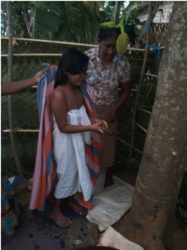
ඡායාරූපය 4. පොල්ලෙබැද්දේ කොටහළු වාරිකුයක් ලෙස කිරි ගහට කෙටීම සිදුකරන ආකාරය

දියණියව ස්නානය කරන මොහොතේදීය. දියණිය ස්නානයට යොදා ගන්නා ලද මැටි බඳුන ගලක ගසා බිඳ දැමීම මව විසින් කරනු ලබයි. එමෙන්ම දියණිය ස්නානය කරනු ලබන්නේද කිරි ගසක් අසලය. ස්නානයෙන් අනතුරුව කිරි ගසට ආයුධයකින් හත්වරක් ඇනීමට සලස්වයි. කිරි ගසකට කෙටීම තුළින් දැරියගේ අනාගතය සෞභාග්‍යමත් කර ගැනීමට බලාපොරොත්තු වේ (සිරිමාන්න, 2022).