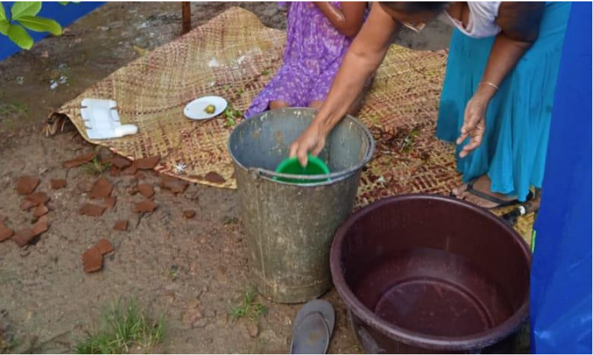
ඡායාරූපය 1. පදියතලාව ප්‍රදේශයේ වස්කළය බිදීම සිදු කරන ආකාරය

නම් වාරිතලාවක් පදියතලාව ප්‍රදේශයේ ගැමියන් විසින් සිදු කරයි (අප්පුහාමි, 2022). වස් කළය දැමීම ලෙස හඳුන්වන්නේ මැටි මුට්ටියකට වතුර පුරවා එය හිස වටේ තෙවරක් කරකවා ඒ අසල ඇති ගලක ගසා වස් කළය විනාශකර දැමීමයි. මෙම ක්‍රියාව සිදු කරනු ලබන්නේ දියණියගේ නැන්දා කෙනෙකු විසිනි. ඉන් අනතුරුව දියණියගේ වස්දොස් දුරු වී යන බව විශ්වාස කරන අතර පසුව මවගේ මුහුණ දැකීමට දියණියට අවස්ථාව සැලසෙයි. වස්කළය දැමීමෙන් අනතුරුව සුදු රෙද්දකින් මුහුණ වසාගෙන දියණියව නිවසේ පිටුපස දොරටුවෙන් ඇගේ කාමරයට රැගෙන පැමිණෙයි. ඉන් අනතුරුව මව, නැන්දනිය හා තවත් කාන්තාවන් කිහිප දෙනෙකු විසින් කිරිබත්ක් හා හත්මාළුවක් පිළියෙල කරනු ලබයි. ඉන් පසුව පිළියෙල කරන ලද කිරිබත්වලින් කිරිබත් ගුළි හතක් සාදනු ලබයි. කිරිබත් ගුළි හත මව විසින් මල්වර දියණිය සිටින ස්ථානයට රැගෙනවිත් ඇය වෙනුවෙන් වත්පිළිවෙතක් සිදුකරයි. දියණියගේ දෑත් දෙකට එකවර කිරිබත් ගුළි දෙක බැගින් තෙවරක් ලබාදෙයි. එම කිරිබත් ගුළි දෙකෙන්ම සුළු ප්‍රමාණයක් අනුභව කොට හිස සිට දෙපතුළ දක්වාම කිරිබත් ගුළිවලින් ස්පර්ශකර තම හිසට ඉහළින් පිටුපස දෙසට විසි කිරීමට සලස්වයි. එමගින් ඇයට සෞභාග්‍ය උදාවන බවත් වස්දොස් දුරු වන බවත් ගැමියෝ විශ්වාස කරති. ඉන් අනතුරුව වෙනමම ඇයට කිරිබත් බෙදූ පිඟානක් සහ කිරිබත් ගුළි හතෙන් ඉතිරි වූ කිරිබත් ගුළියන් හත්මාළුව සමඟ අනුභව කිරීමට ලබාදෙයි. ඉන් අනතුරුව ස්නානය කරන දින දක්වාම දියණියට නියමිත වූ කාමරයේ රැඳී සිටිය යුතුය (සිරියාවතී, 2022). මෙම සියලුම වාරිතලා පදියතලාව ප්‍රදේශයටම අනන්‍ය වූ ඒවා වීම විශේෂය.