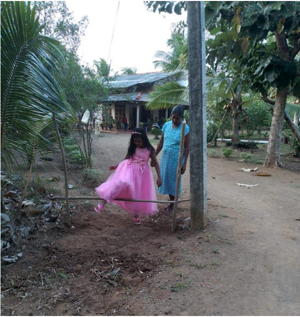
ඡායාරූපය 5. පොල්ලෙබැද්ද ප්‍රදේශයේ වාරිතලාවක් පෙස වැට පැනීම සිදුකරන ආකාරය

ජනතාව අතීත පරම්පරාවෙන් තමන්ට උරුම වූ ආදිවාසී උරුමයන් යම් පමණකට හෝ ආරක්ෂා කර ගනිමින් මතු පරම්පරාවට ද ඒවා දැක බලා ගැනීමටත්, ආරක්ෂා කර ගැනීමටත් ලබා දී ඇති අවස්ථාවන් විද්‍යමාන විය. ඒ වගේම මෙහිදී ද පදියතලාවේ මෙන්ම වාරිතලා වාරිතලා සිදු කිරීමේදී ශ්‍රී ලාංකී මිත්‍රාදී සමූහයේ ඒකරාශී වීමත් ඒ ඔස්සේ දියණියට ලබා දෙන ආරක්ෂාකාරී හැඟීමක් පැහැදිලි විය.