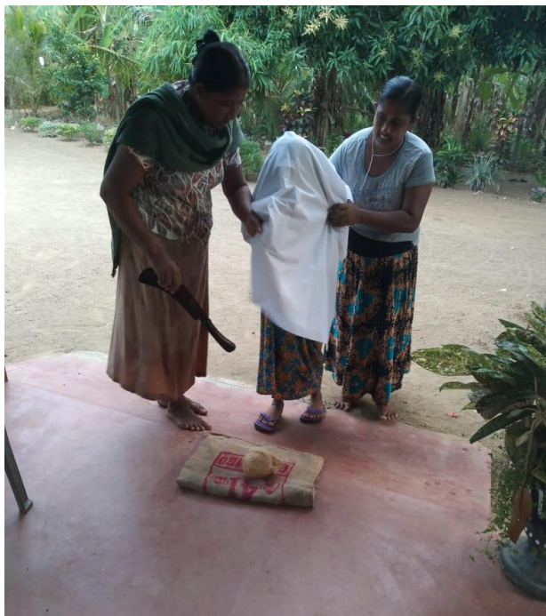
ඡායාරූපය 6. උහන ප්‍රදේශයේ වාරිතයක් ලෙස පොල් ගෙඩිය බිදීම

වටකොට ආවරණය කර ඇත. මෙම ස්ථානයේදීම දියණියට ඇඳුම් ඇන්දවීම සිදුකරයි. ඉන් පසු ඉදිරිපස දොරටුවෙන් නිවසට ඇතුළු වෙයි. එසේ ඇතුළුවන විට පළමුව දියණියව පිළිගැනීමට ඉදිරිපස සිටින්නේ දියණියගේ පියා ය. පියා විසින් ඉදිරිපසින් සිටගෙන මල් දැමූ ජල බඳුනක් තබාගෙන සිටින අතර ඉන් ස්වල්පයක් දියණියට පානයට ලබා දී ඇයව ආදරෙන් පිළිගනී. මල්වර දියණිය පළමුව දකින පුරුෂයා ලෙස පියා යොදාගෙන ඇත්තේ ඇයට සම්පතම, ආදරණීයම, ලෙන්ගතුම හා නිබඳ ඇයට ආරක්ෂාව සපයන පුද්ගලයා ලෙස සමාජය විසින් අරුත්ගන්වන නිසා විය යුතු ය.